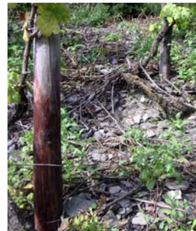
De bodem – een zuiver mineraal

We hebben onze onderscheiding bekomen ten gunste van de kwaliteit, omdat we afgezien hebben van een overvloedige opbrengst. Economische aspecten plaatsen zich daarbij dikwijls op de achtergrond.