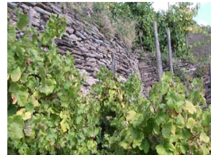
Uniek micro- klimaat in de rotsterrassen

Bijzonder nauw aan het hart ligt ons de Zeltinger Sonnenuhr, die wereldwijd één van de weinige Top-Rieslinggebieden is. Rots- en muurterassen, maar ook uiterst steile leisteengebieden met mineraalhoudende Devonleisteelsteen drukken hun stempel op het gebied. We houden de meer dan honderdjarige druivensoorten in stand, doordat we de stokken verder vermeerderen en aldus de genetische hulpbronnen bewaren.